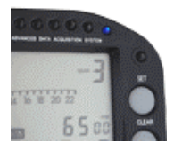
ギアポジション表示