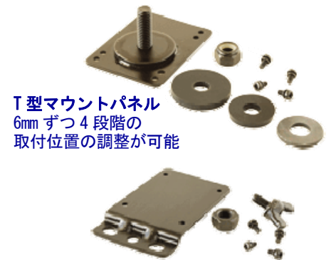
T型マウントパネル 6mm ずつ4段階の 取付位置の調整が可能

本体とディスプレイが一体のコンパクト設計で、取付け・配線が簡単。カート・ミニバイクに最適。2種類のオプションのマウントパネル&固定ネジで、車両ステアリングなどに簡単に取り付け可能。