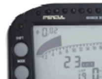
ベストラップ、目標ラップとの比較表示

全機種でバーグラフ表示可能なマルチディスプレイ装備。ベストラップとの比較表示やギアポジション表示が可能。 ※オプションでバックライト装着が可能