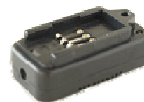
卓上バッテリー チャージャー