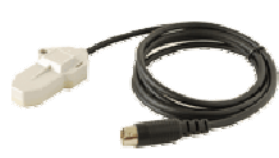
カート用磁気センサ