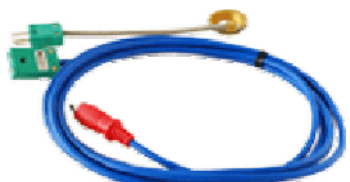
プラグ座温センサ オプション