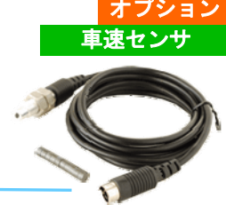
オプション 車速センサ