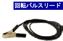
回転パルスリード