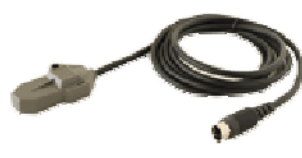
高感度磁気センサ